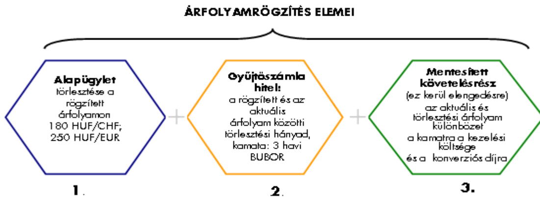
7. ábra Árfolyamgát jellemzői